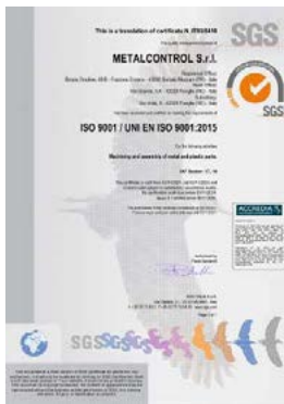
ISO 9001-ZERTIFIKAT IT